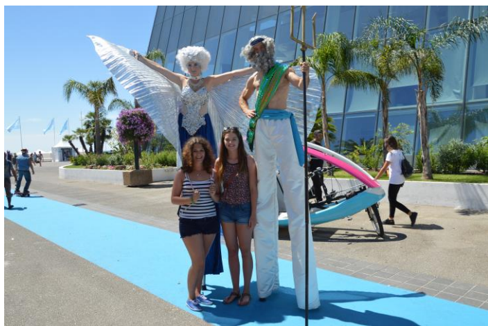
Obr. Žákyně SSOŠ v Cannes, Francie